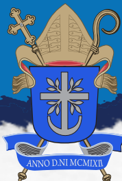
Diocese de Juazeiro Bahia